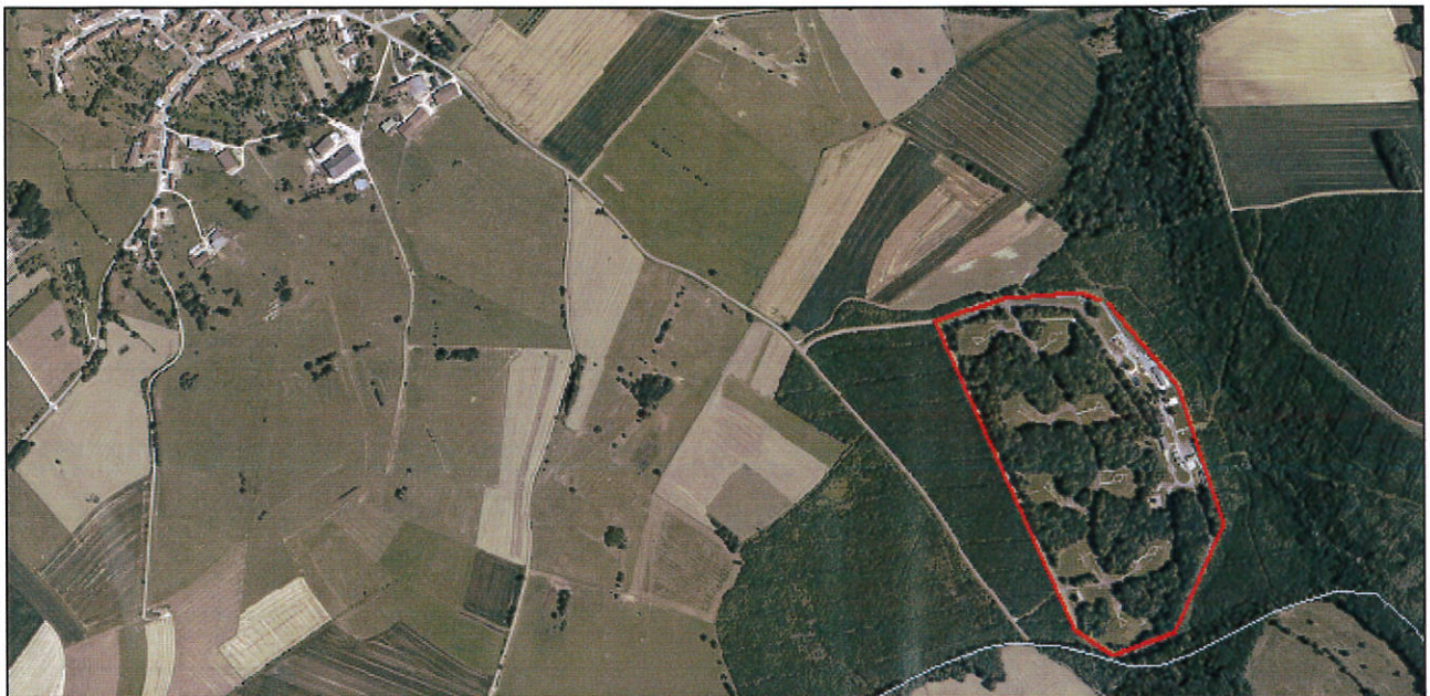
Dépôt d'hydrocarbures d'Heuilley-le-Grand