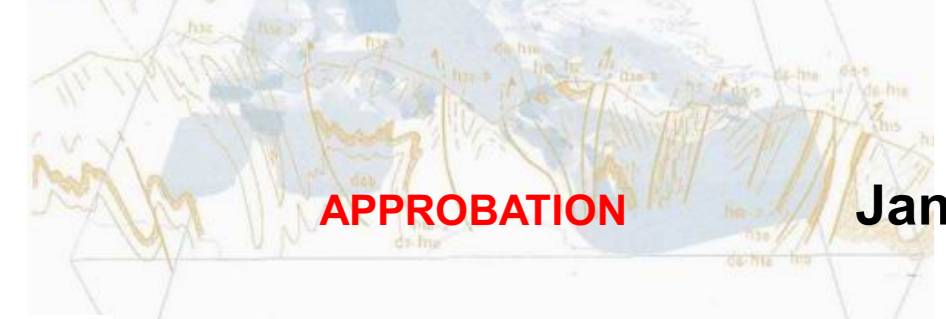
PLANCHE 1 Echelle 1/5000