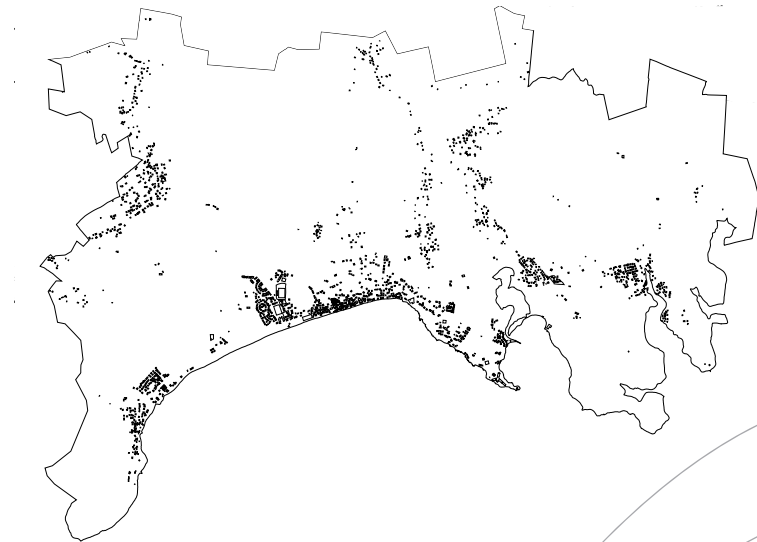
Répartition de l'habitat sur la commune du DIAMANT