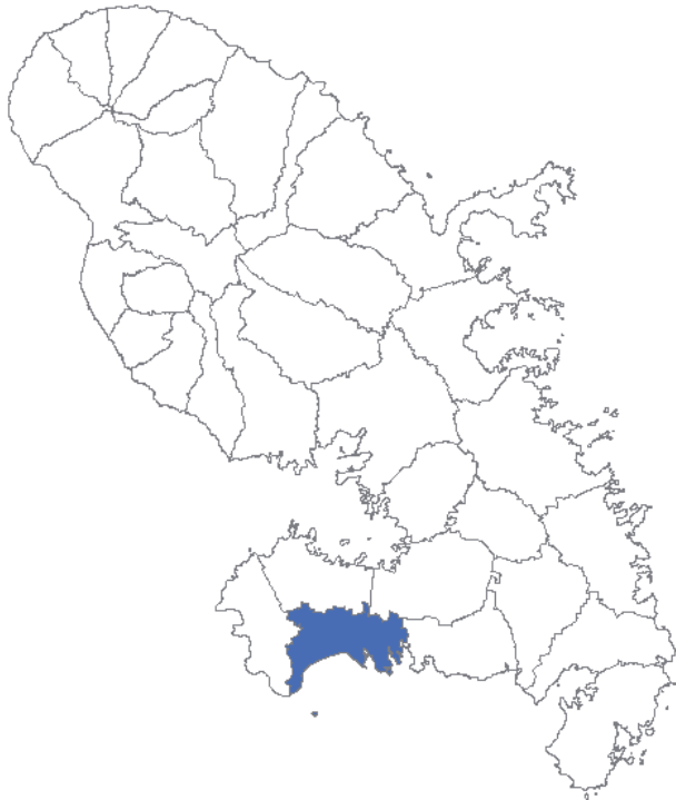
Situation géographique de la commune du DIAMANT