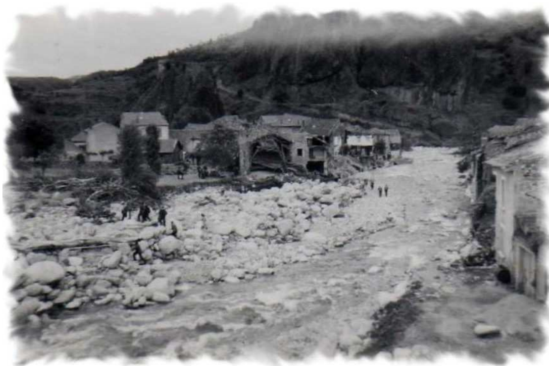
Crue de la Seuge du 16 juin 1951

Plan de Prévention du Risque Inondation de l'Allier, de la Besque et de la Seuge