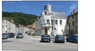
CURSIER : ALCAÏA