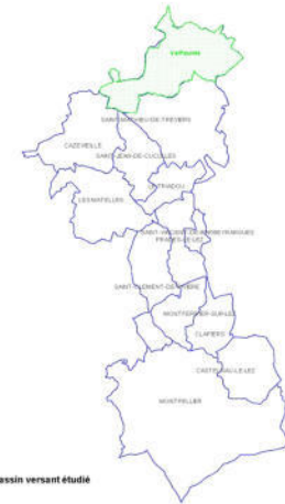
Bassin versant étudié