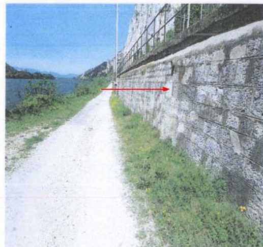
Emplacement repère n°1