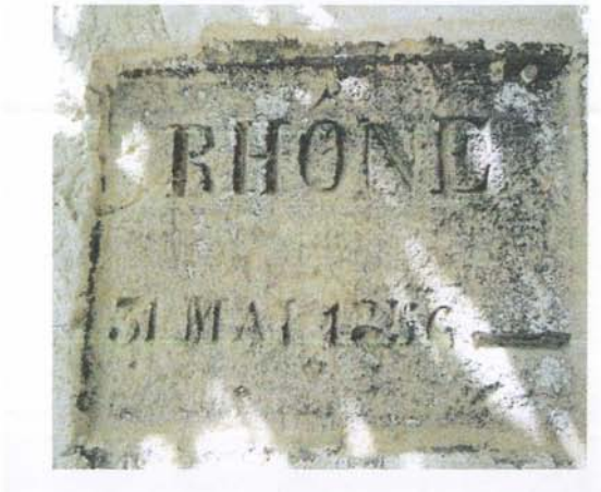
Repère n°3 – ferme du Pont du Robinet