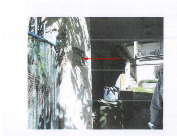
Emplacement repère n°3