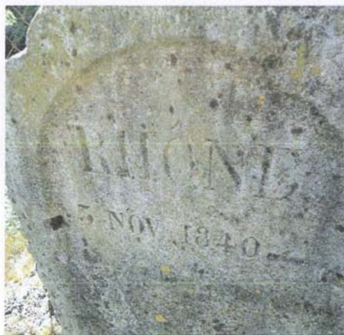
Repère n°2 – ferme du Pont du Robinet