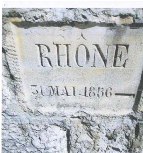
Repère n°1 – voie de chemin de fer - Pont du Robinet

La liste des repères de crues existants sur le territoire de la commune est incluse dans le DICRIM (article R563-15) du code de l'environnement avec mention de l'indication de leur implantation.