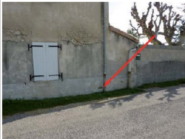
Repère n°2 : chemin de la plaine