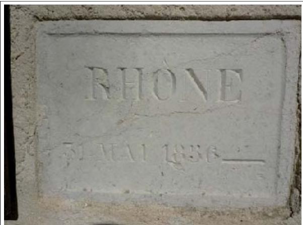
31 mai 1856 - plaque de pierre gravée – bon état