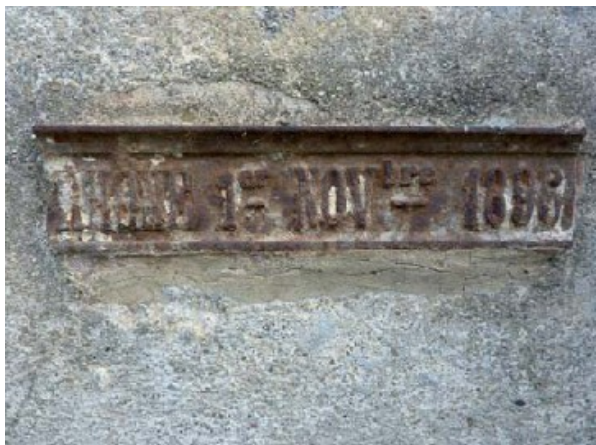
1er novembre 1896 - barre métallique – mauvais état