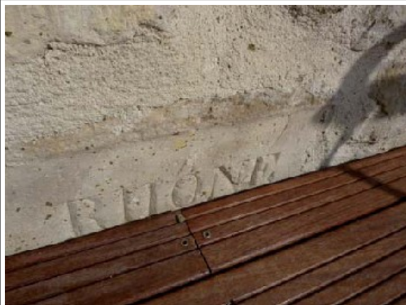
Repère n°1 : quartier de la Tête Noire, sur mur de la ferme des Roches – plaque de pierre gravée – bon état

Le recensement des repères de crue effectué par l'Établissement Public Territoire Rhône en 2010, permet de localiser 3 repères sur la commune de Savasse.