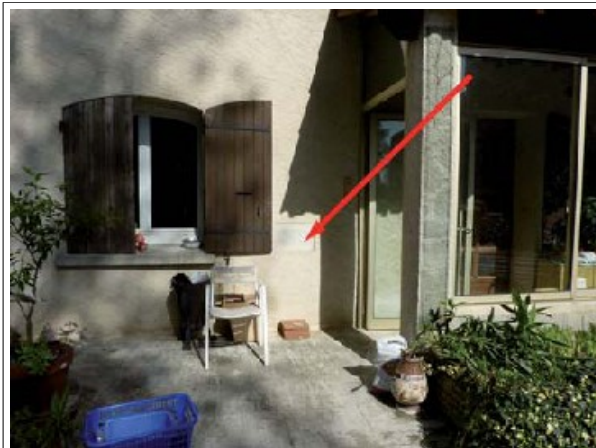
Repère n°3 : quartier Vireille, sur le mur d'une maison