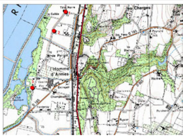
Plan de situation des 3 repères de crue du Rhône