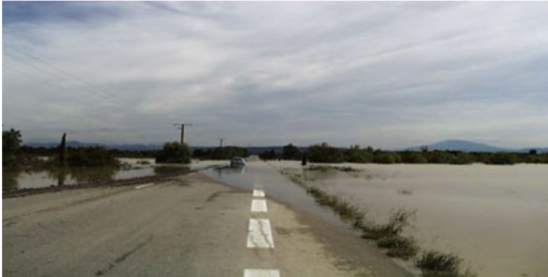
Inondation d'une route près de Rohegude

Le débordement indirect d'un cours d'eau peut se produire: par remontée de l'eau dans les réseaux d'assainissement ou eaux pluviales ; par remontée de nappes alluviales ; par la rupture d'un système d'endiguement ou autres ouvrages de protection.