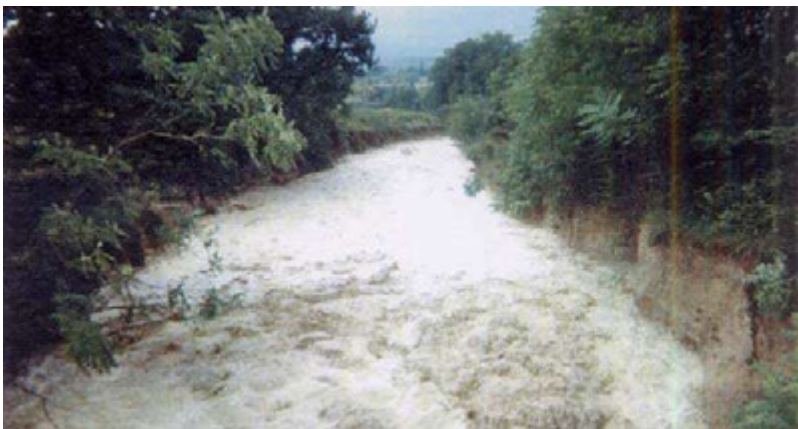
Le Grand Vallat (1993). Commune de Valréas

Ce type de phénomène se retrouve par ailleurs dans les vallats (ou talwegs).