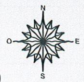
Planche n°1 Echelle 1/10 000