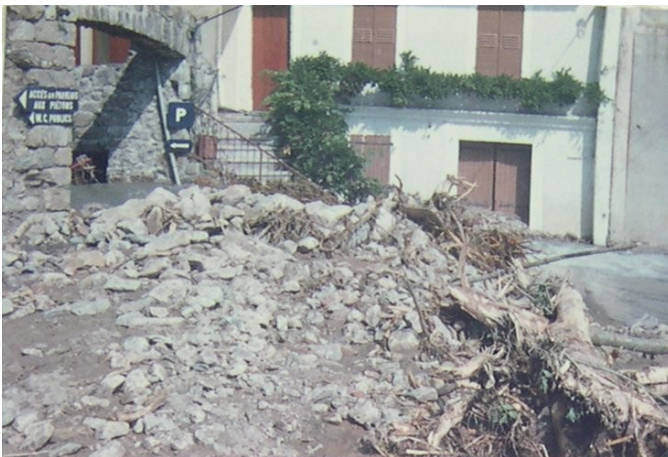
Crue du Saint Laurent, Septembre 1980 (Photos de Mme Assenat).