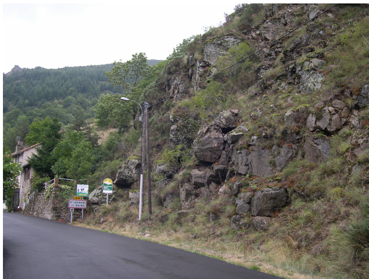
Zone fortement fracturée située à l'entrée du village (zone d'aléa n°14)