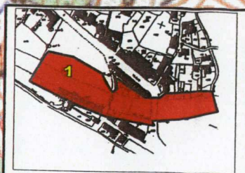
Bourg de Mayres Zone en amont du pont de Mayres