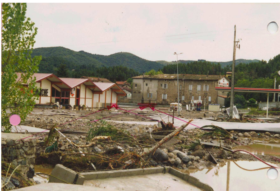
Intermarché de Lalevade : laisses de la crue de septembre 1992