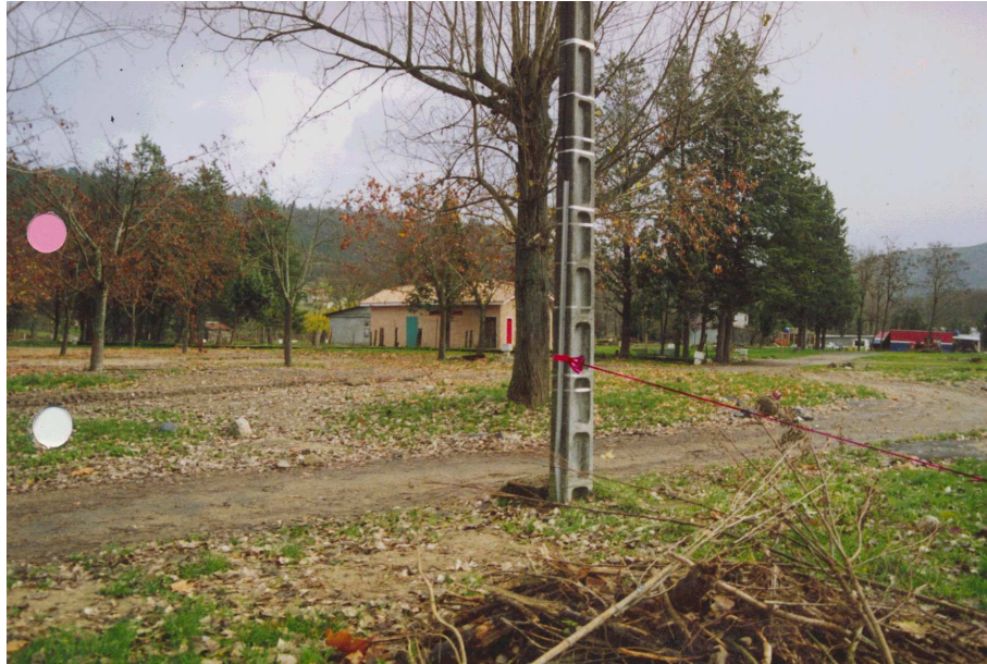
Camping de Lalevade : laisse de la crue de septembre 1992

Toutes les dispositions réglementaires contenues dans le PPR ont été reprises ci-dessous, avec pour chacune d'elles l'objectif (ou les objectifs) qu'elles soutendent.