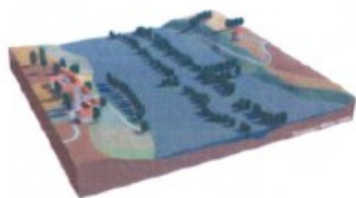
l'événement : l'aléa

Le risque est la possibilité qu'un événement d'origine naturelle, ou lié à une activité humaine, se produise, dont les effets peuvent mettre en jeu un grand nombre de personnes, ou occasionner des dommages importants, et dépasser les capacités de réaction de la société.