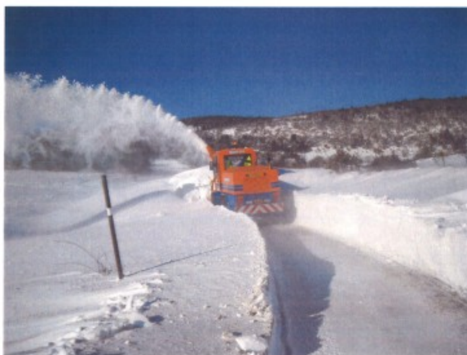
AUREL EN HIVER