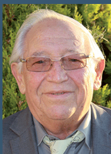
Le maire de Le Thoronet

En de telles circonstances, vigilance et entraide sont nécessaires et salvatrices