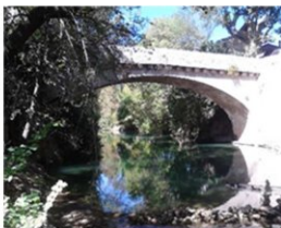
Pont en pierres de Correns

Par ailleurs, le haut de la rue du Cros a été identifié comme étant un axe de ruissellement en cas d'intenses précipitations.