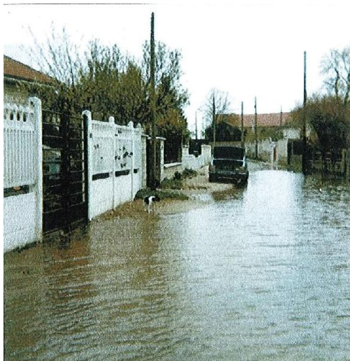
Chemin de la Marne en 1982