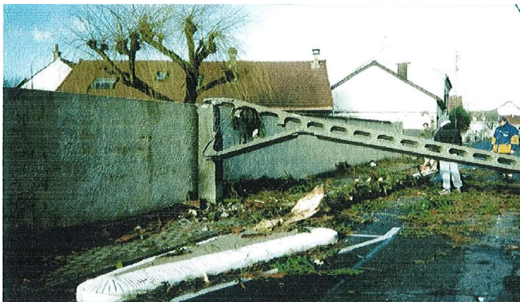
Tempête de 1999