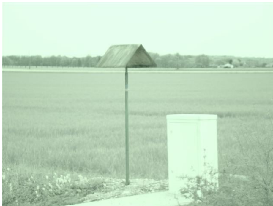
Ces chapiteaux jaunes indiquent le passage d'une canalisation de gaz.