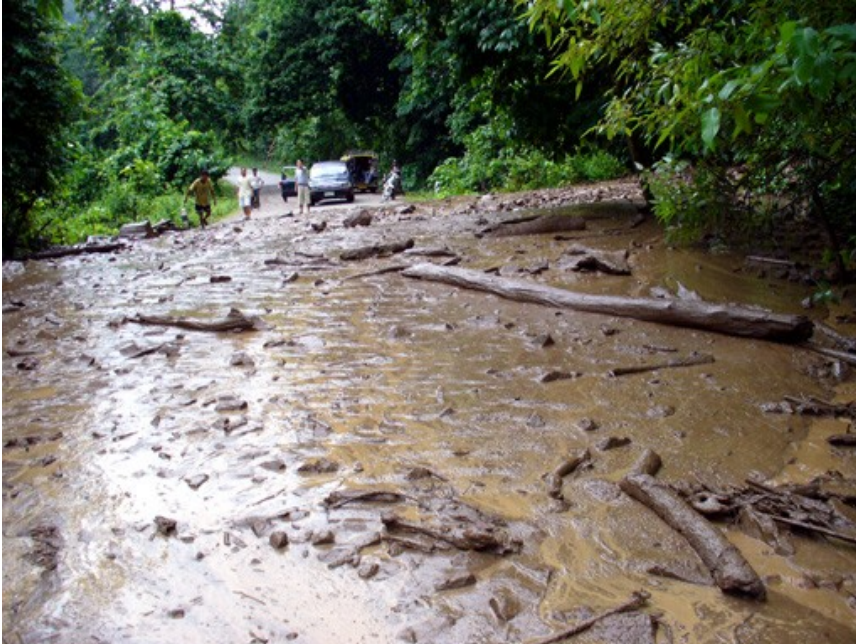
Coulée de boue.

Au delà des risques climatiques majeurs pouvant toucher notre commune et plus généralement notre secteur :