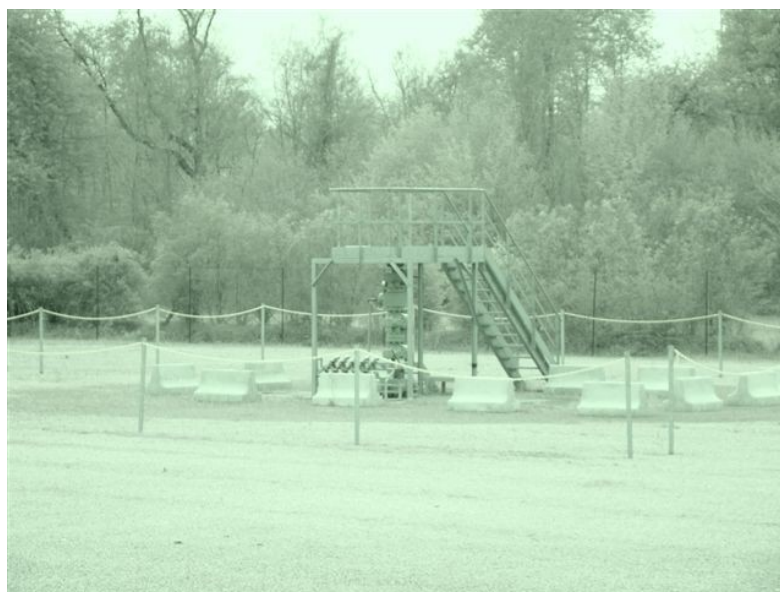
Plate-forme de la « Route du gaz » à Crouy-sur-Ourcq.