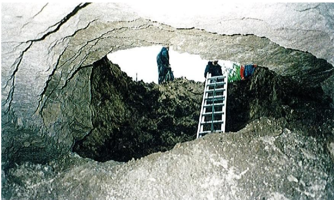
Cavités souterraines à Crouy-sur-Ourcq

Une mission de reconnaissance des sols in situ et par sondages a été réalisée par le Laboratoire Régional de l'Est Parisien en 1996, suivie du comblement des cavités découvertes.