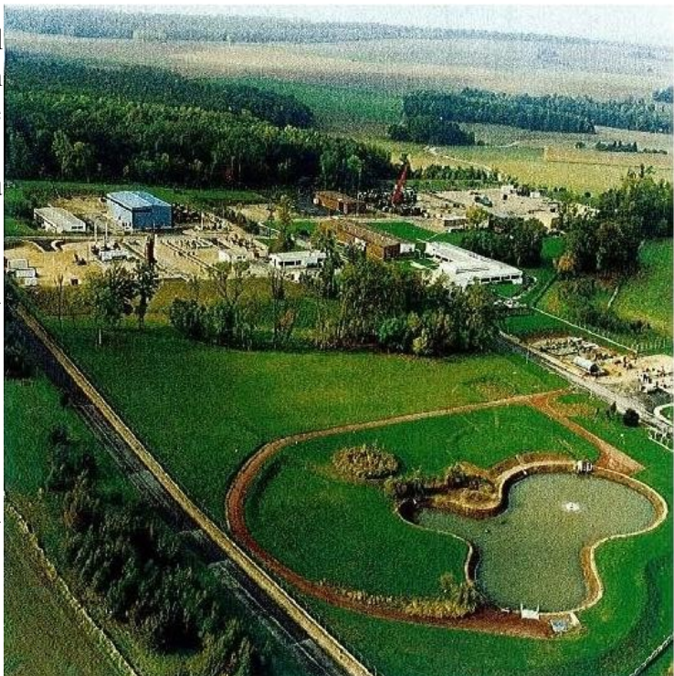
Installations de GrDF à Germigny-sous-Coulombs.