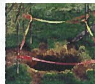
Mouvement de terrain