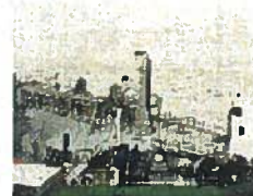
Transport de matières dangereuses