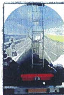
Transport de matières dangereuses