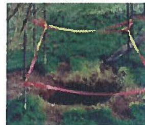
Mouvement de terrain (cavités souterraines)