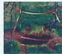
Mouvement de terrain (cavités souterraines)