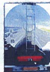
Transport de matières dangereuses