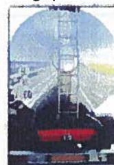
Transport de matières dangereuses