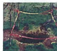
Mouvement de terrain (cavités souterraines)