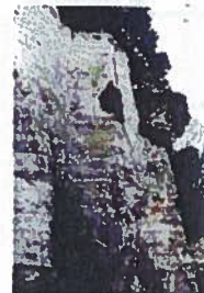
Mouvement de terrain

(cavités souterraines - falaise principalement en forêt)