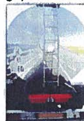
Transport de matières dangereuses