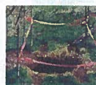
Mouvement de terrain (cavités souterraines et falaise)