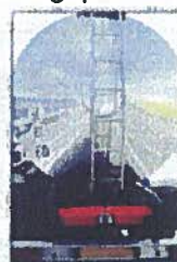
Transport de matières dangereuses