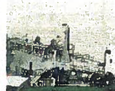
Transport de matières dangereuses