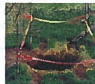
Mouvement de terrain (falaise et cavités souterraines)