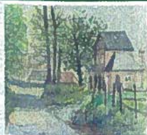
Mairie de Colmesnil-Manneville

L'article L.125-2 du code de l'environnement précise que "les citoyens ont un droit à l'information sur les risques majeurs auxquels ils sont soumis dans certaines zones du territoire et sur les mesures de sauvegarde qui les concernent." Informés, les citoyens intégreront mieux le risque majeur dans leur vie courante, pour mieux s'en protéger et acquerront ainsi une confiance lucide, génératrice de bons comportements individuels et collectifs.