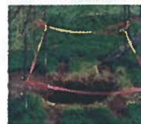
Mouvement de terrain (cavités souterraines)