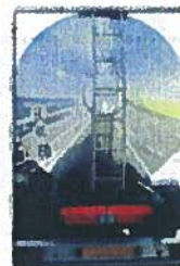
Transport de matières dangereuses