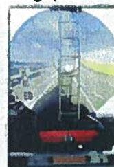
Transport de matières dangereuses