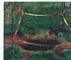
Mouvement de terrain (cavités souterraines)