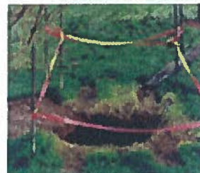
Mouvement de terrain (cavités souterraines)