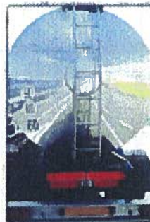
Transport de matières dangereuses