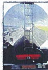
Transport de matières dangereuses