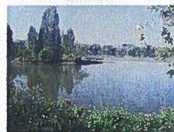
Inondation (uniquement certains secteurs)