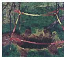
Mouvement de terrain (cavités souterraines)