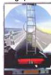
Transport de matières dangereuses