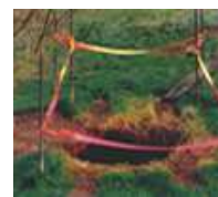
Mouvement de terrain (cavités souterraines)