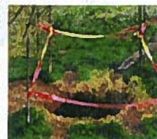
Mouvement de terrain (cavités souterraines)