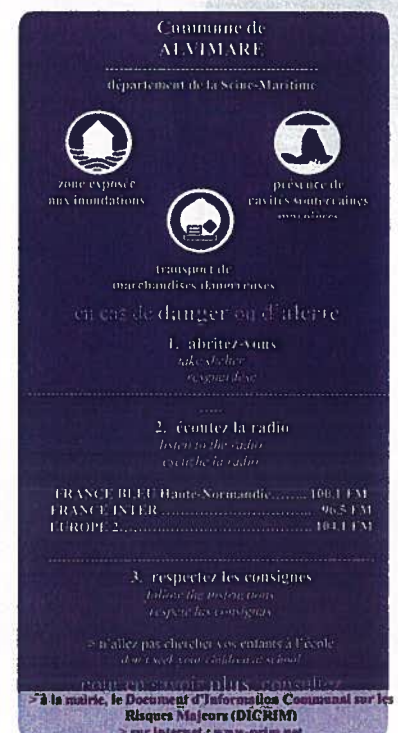
Modèle de l'affiche qui sera apposée par le maire dans les établissements recevant du public (ERP)

Les affiches sont disponibles en mairie. Le plan d'affichage, élaboré par le maire, répertorie risque par risque les locaux de plus de 50 personnes ou 15 logements situés dans les zones concernées. Au vu du plan d'affichage, les affiches devront être apposées par les propriétaires à chaque entrée de bâtiments ou à raison d'une affiche par 5000 m 2 pour les terrains de camping et stationnement de caravanes.