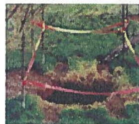
Mouvement de terrain (falaise et cavités souterraines)