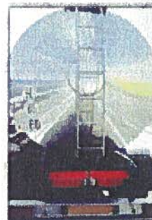
Transport de matières dangereuses