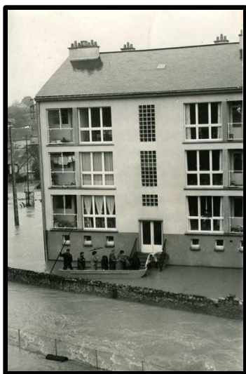
Inondation du 2 janvier 1961 Rue du Grand Douai

Au niveau de l'urbanisme, le P.P.R.I. (annexé au P.L.U.) régit l'usage du sol et impose des mesures obligatoires à mettre en œuvre pour les habitations implantées en zone inondable.