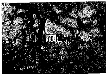
Mairie de Doranges Le Bourg 63 220 Doranges