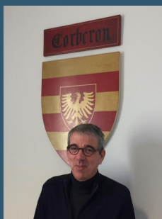
Le maire de Corberon

En de telles circonstances, vigilance et entraide sont nécessaires et salvatrices.