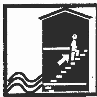
Montez à pied dans les étages