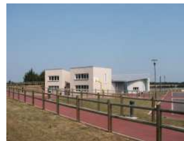
Le Centre Sportif et Culturel.

En cas d'évacuation due aux risques majeurs, les lieux d'hébergement de la commune sont :