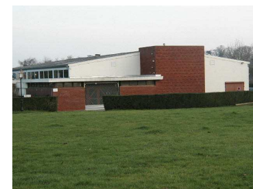
La Salle des Fêtes.