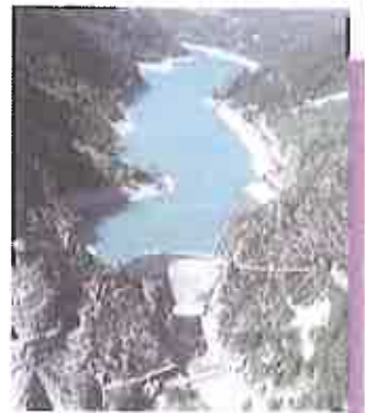
• Barrage de l'Chaudanne

site portail thématique du ministère de l'Ecologie, de l'Energie, du Développement durable et de la Mer dédié à la prévention des risques majeurs