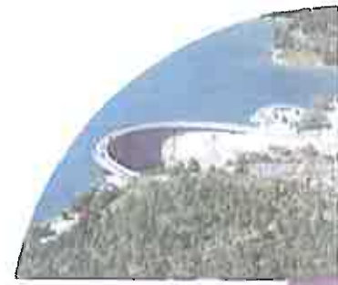
• Barrage de Castillon