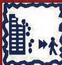
Evacuez les bâtiments endommagés