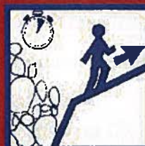
Gagnez un point en hauteur