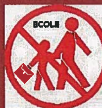
N'allez pas chercher vos enfants à l'école