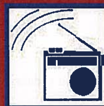
Ecoutez la radio