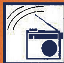
Ecoutez la radio