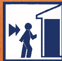
Enfermez-vous dans un bâtiment