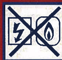
Coupez l'électricité et le gaz