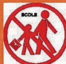
N'allez pas chercher vos enfants à l'école