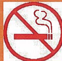
Ni flamme, ni fumée. Ne fumez pas