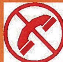
Ne téléphonez pas