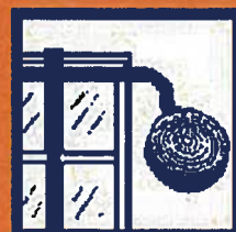
Bouchez toutes les arrivées d'air